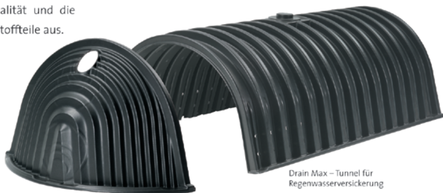
Kalotte für Drain Max